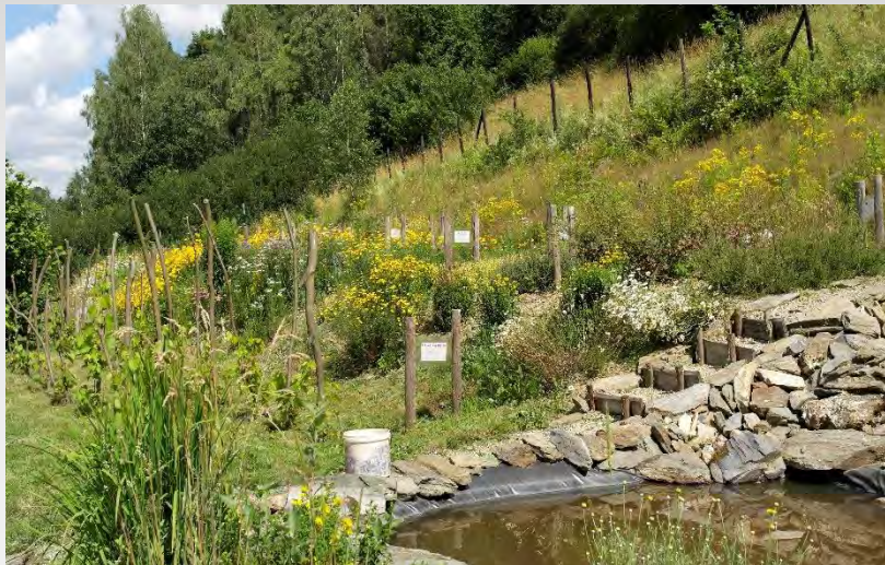
Chrośnica - wioska barwnych wątków