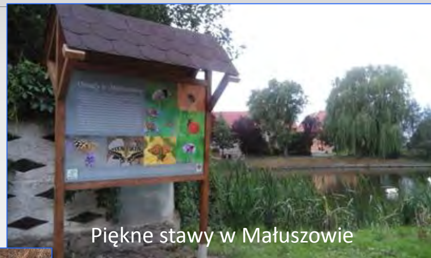
Piękne stawy w Małuszowie