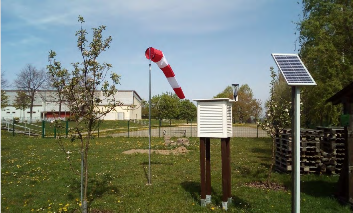
Stacja Meteorologiczna SAPOS