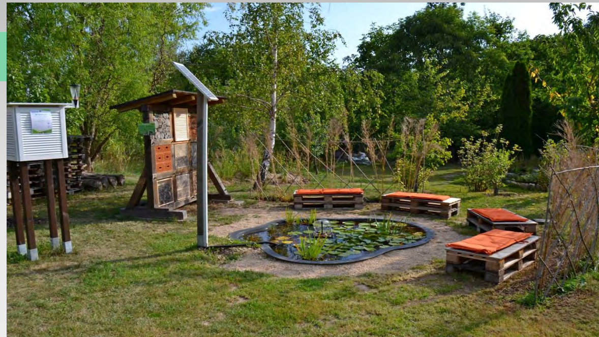
Staw z odprowadzeniem nadmiaru wód deszczowych Görlitz - SAPOS