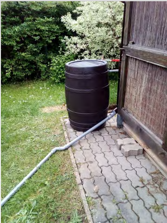
Gromadzenie wód deszczowych Görlitz - SAPOS