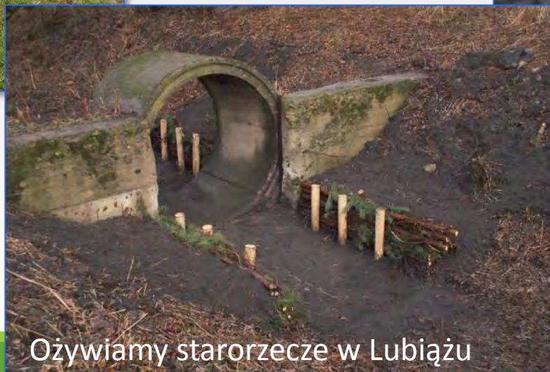
Ożywiamy starorzecze w Lubiążu