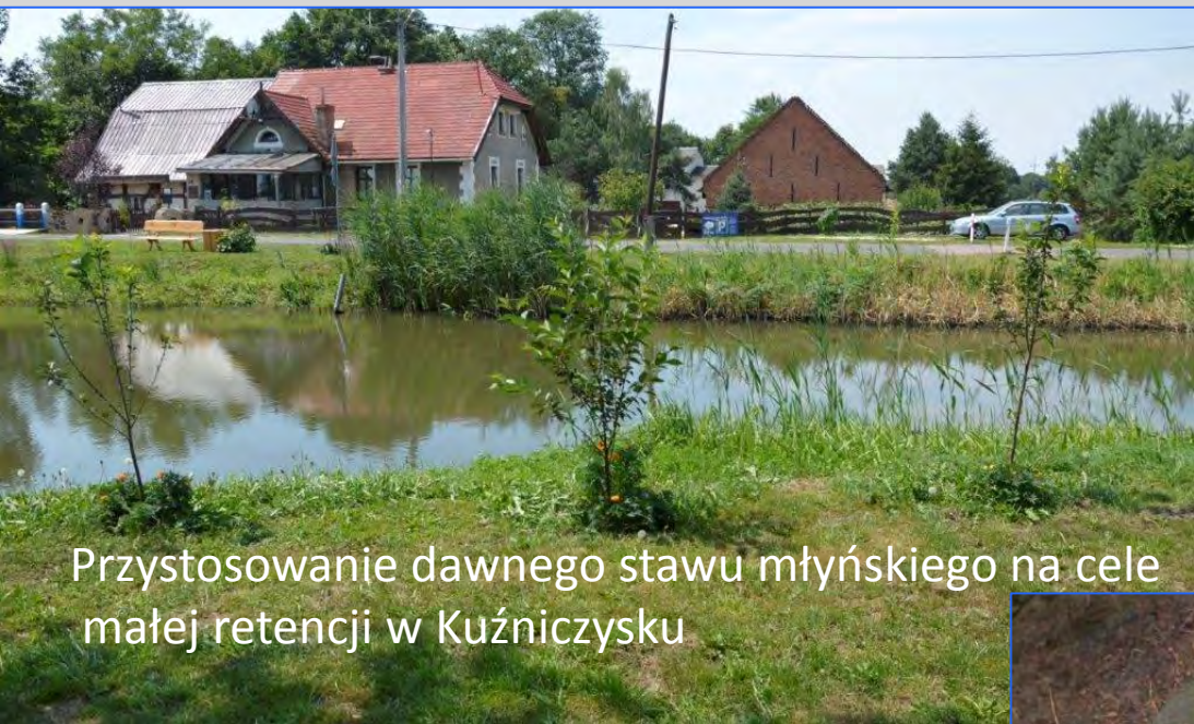
Przystosowanie dawnego stawu młyńskiego na cele małej retencji w Kuźniczysku