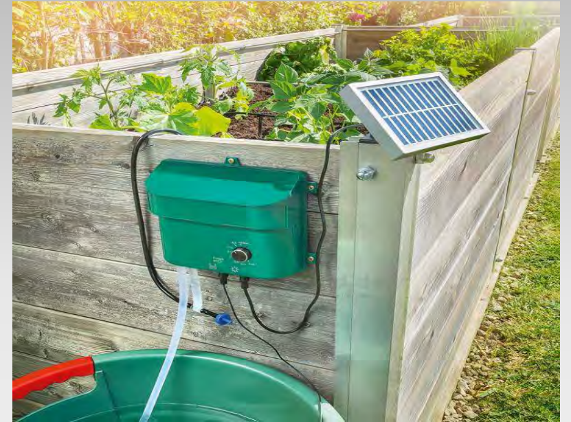
Podwyższona rabata wraz z systemem nawadniania Görlitz SAPOS